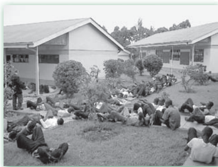
Kitale High School, Rift Valley, Kenia

Da es hier offensichtlich um den langfristigen Erholungsprozess einer ganzen Schülerschaft ging, war es notwendig, die oben erwähnten