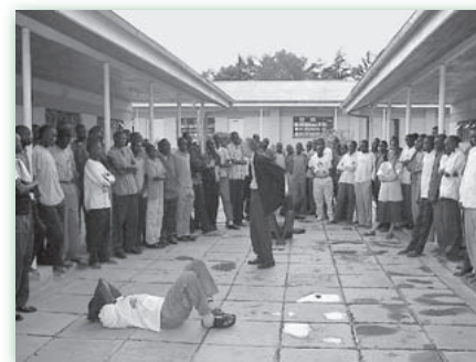
Sudanesische Kriegsflüchtlinge lernen Übungen

Das zweite Fallbeispiel ist eine Erfahrung aus der Zeit meiner dreijährigen Arbeit im Sudan. Da wurde ich einmal gebeten, eine Schule zu besuchen, deren ganze Schülerschaft aus sudanesischen Flüchtlingsjungen bestand. Die Lehrer hatten Schwierigkeiten mit diesen Schülern, und sie sahen auch, dass ihre eigenen Beziehungen innerhalb des Kollegiums vom Verhalten der Schüler schwer belastet waren. Als ich ankam, befragte ich sowohl die Lehrerschaft als auch die versammelten Schüler. Ich entdeckte, dass das Kollegium unter sekundärem Trauma – einer Traumatisierung durch Ansteckung – litt. Dies war die unbewusste